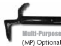
Multi-Purpose (MP) Optional