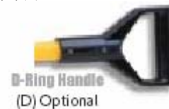
D-Ring Handle (D) Optional