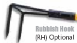
Rubbish Hook (RH) Optional