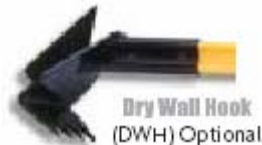
Dry Wall Hook (DWH) Optional